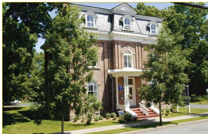
Un maire... une ville