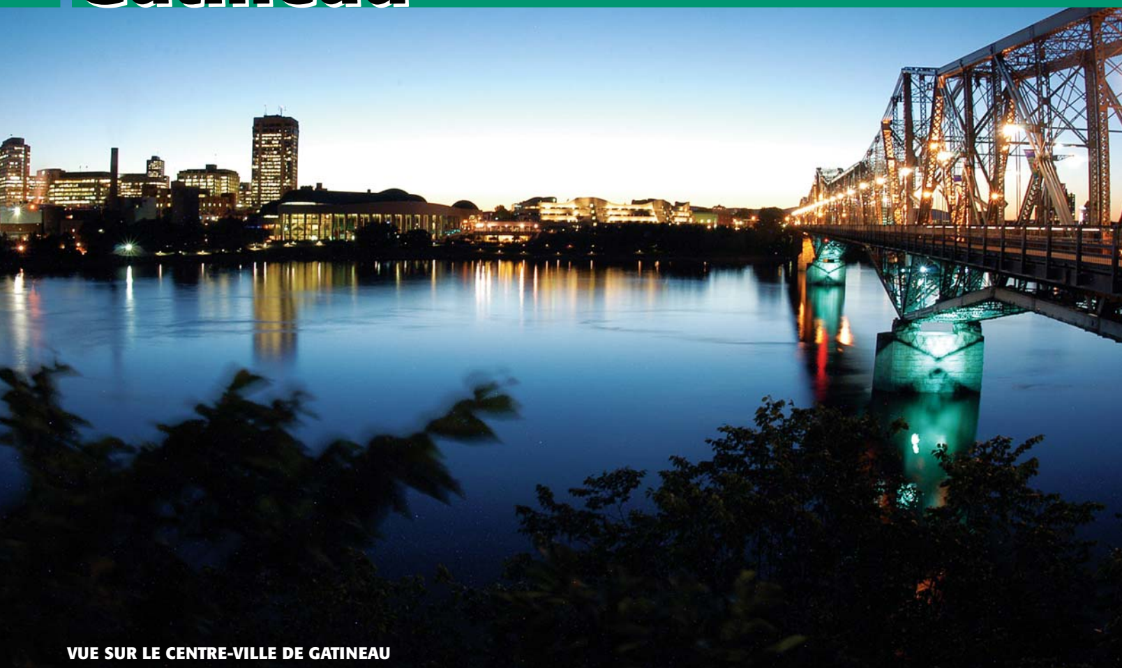
VUE SUR LE CENTRE-VILLE DE GATINEAU